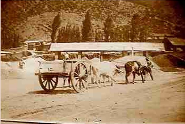
Cancha de acopio de minerales.