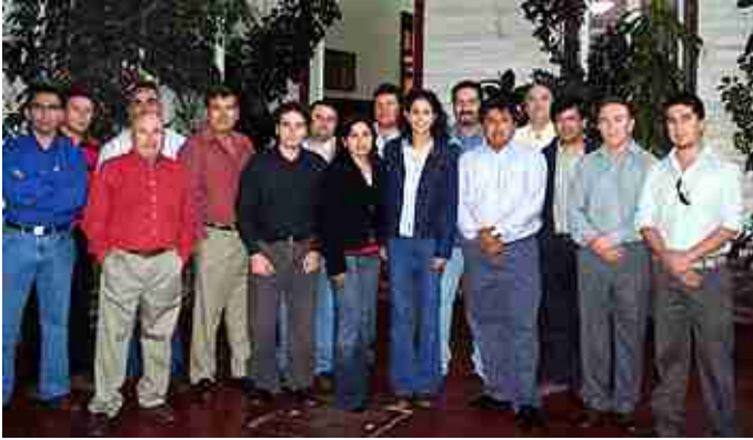
Cena Anual Supervisores.