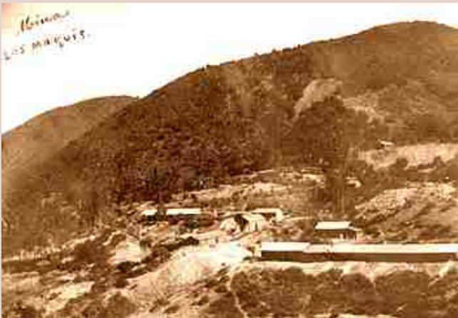
Mina Los Maquis.