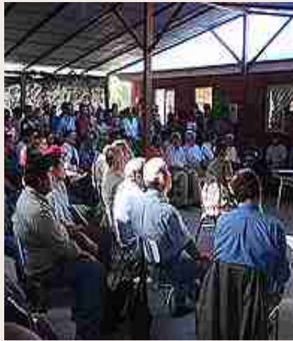
Asistentes al Taller.

C- Cal: Además, se utiliza en el proceso de Flotación en forma previa, dosis de CAL (materia inerte), entre 600 y 1.000 gramos por tonelada de mineral, la cual tiene por objeto regular el pH y sirve para deprimir