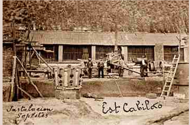
Antigua Estación Cabildo.