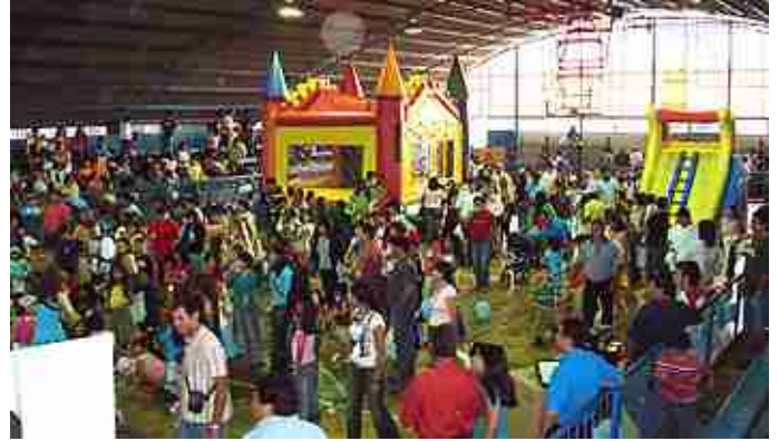
Fiesta de Navidad.