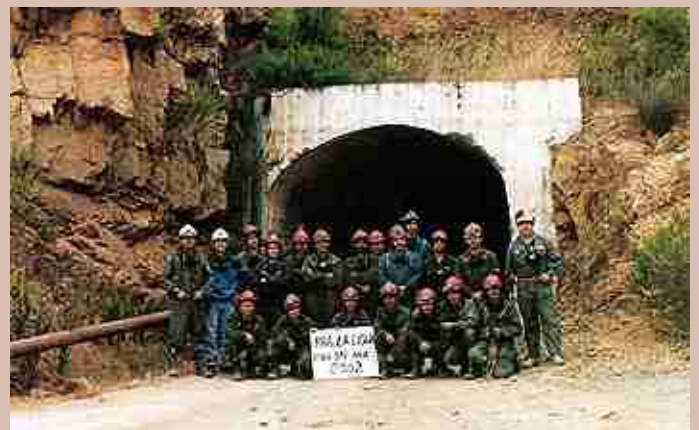
Cabildo, Mina Santa Ana. Octubre 2002.