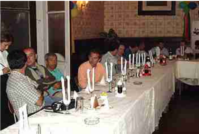
Cena Anual Supervisores.