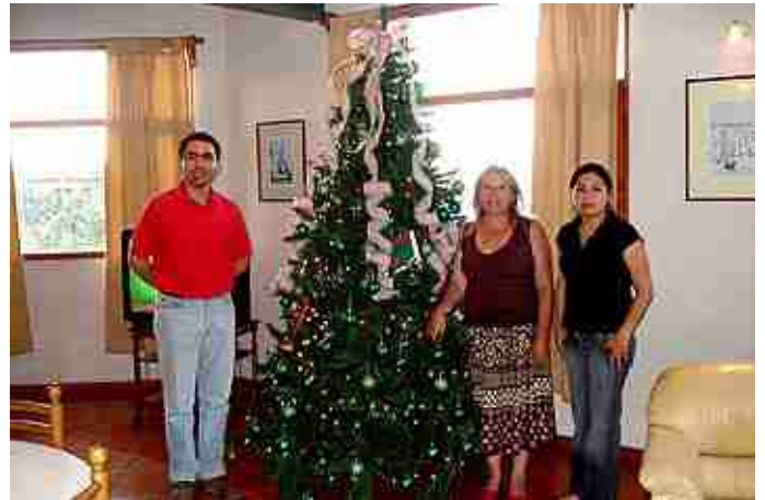
Arbol de Navidad Casa de Huéspedes.