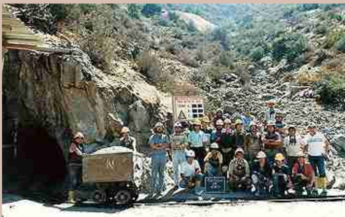
Cabildo, Mina Botón de Oro. Marzo 1989.