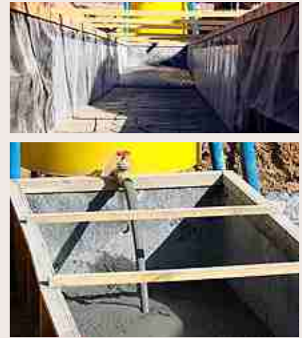
Pruebas para el Depósito en pasta.