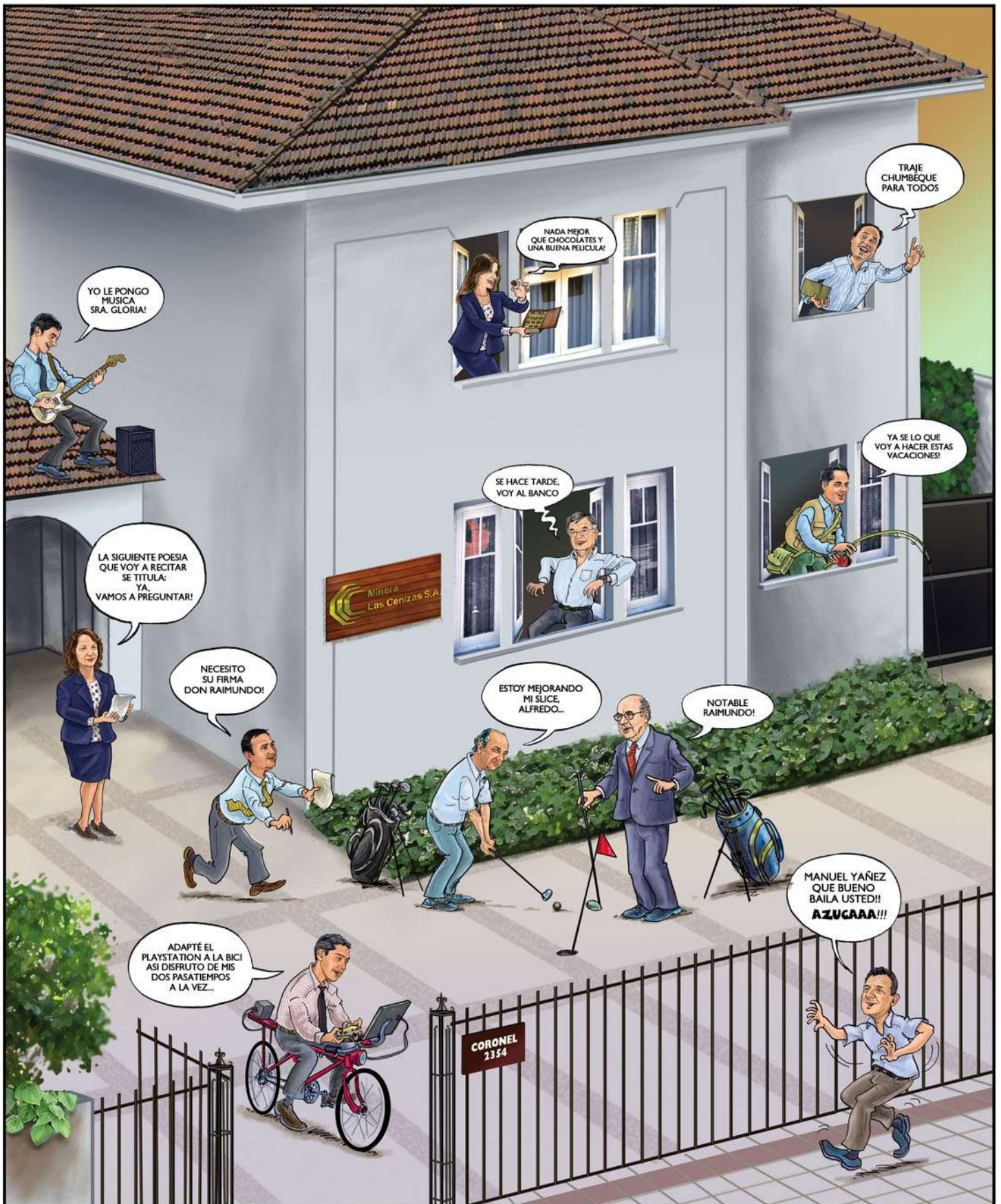
Ilustración: Jaime Oddo