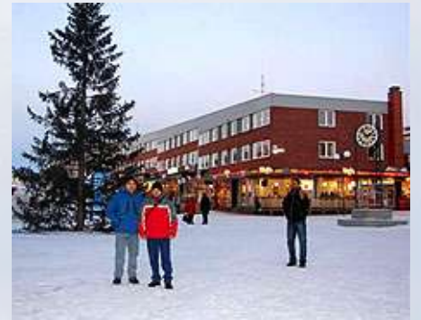
Suecia, localidad de Kiruna, ubicada en el Círculo Polar Ártico, donde se ubica la mina de hierro más grande y moderna del mundo.

Boris Álvarez permaneció en Europa desde el 2 al 19 de noviembre (2007).