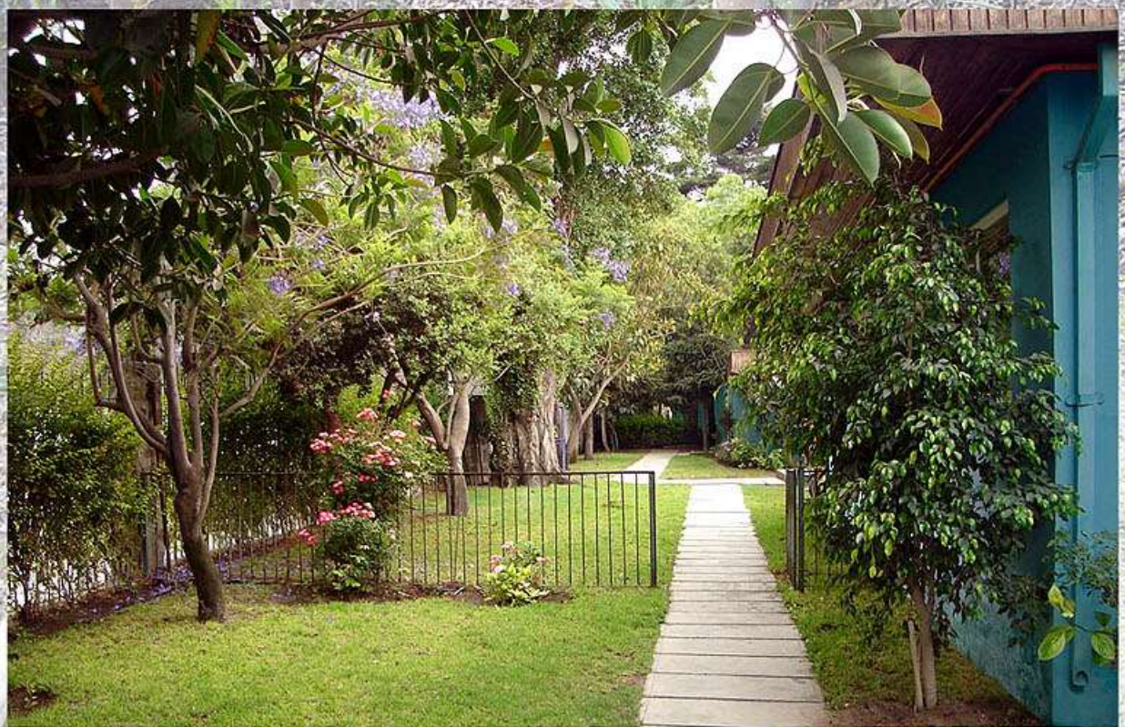
Oficinas en Faena Cabildo. Al fondo, el tranque forestado.