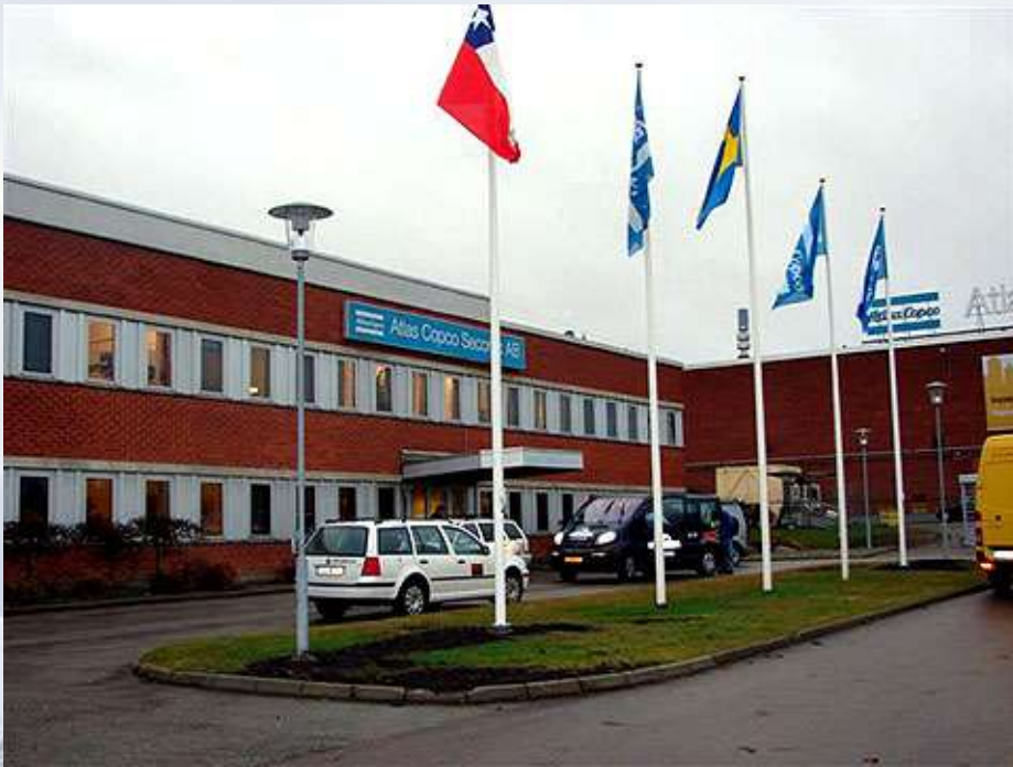
Fábrica de Atlas Copco, Fagersta, Suecia.