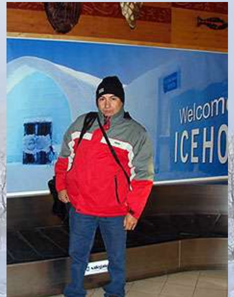
Atracción de Kiruna, donde se construye un hotel de hielo.