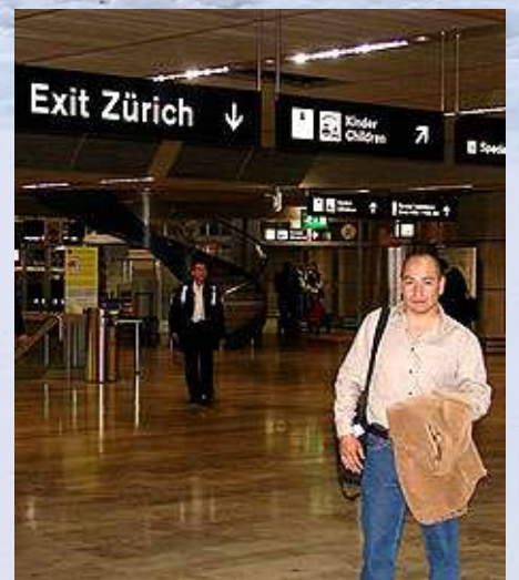
Aeropuerto de Suiza.