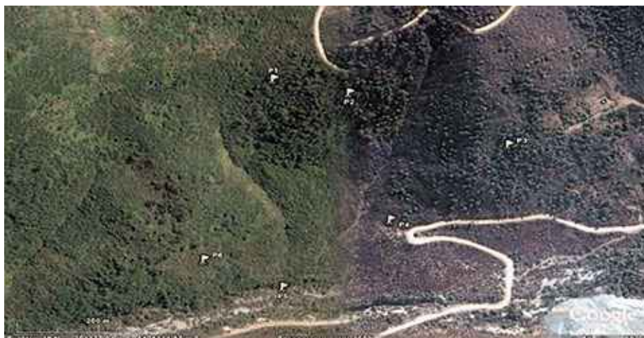
Imagen Satelital: zona de Exclusión y Parcelas Permanentes.