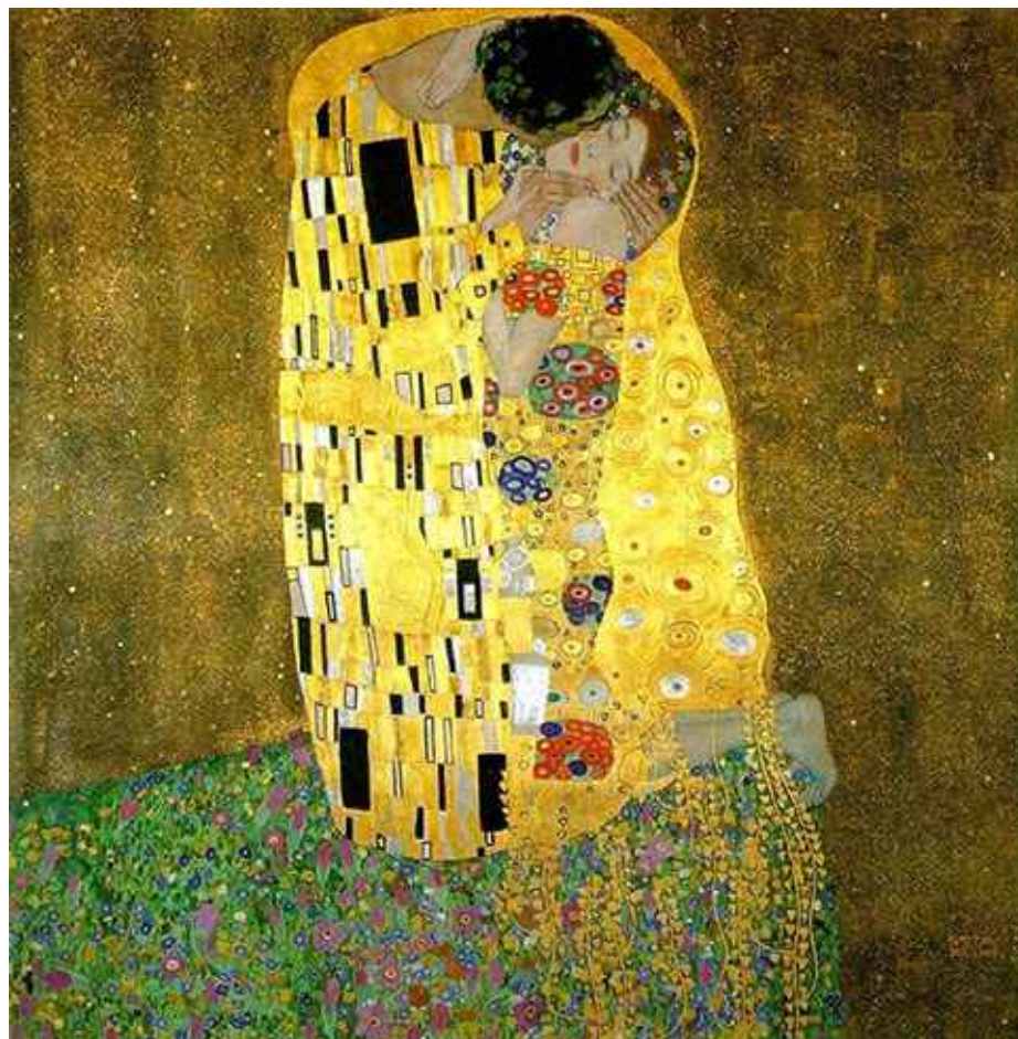
El beso, Gustav Klimt (1907-8).

De este modo sabemos que el mundo de la mujer es el mundo de la ternura, es el mundo del amor, por eso junto a ellas podemos nosotros crecer, podemos