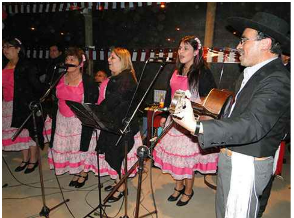
Grupo Folklórico Las Cenizas.