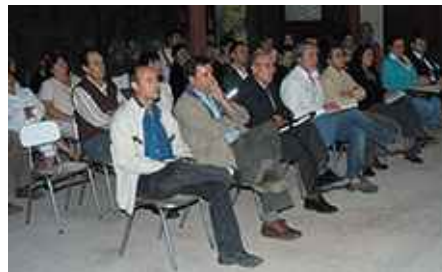
Conformación de mesa de trabajo.

A la fecha, la comunidad de Peñablanca ha efectuado dos visitas al área de emplazamiento del Proyecto DEP: la primera en septiembre de 2009 y la segunda en julio de 2010.