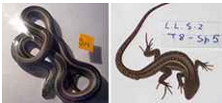
Actividad de Rescate de Fauna y Micromamíferos.