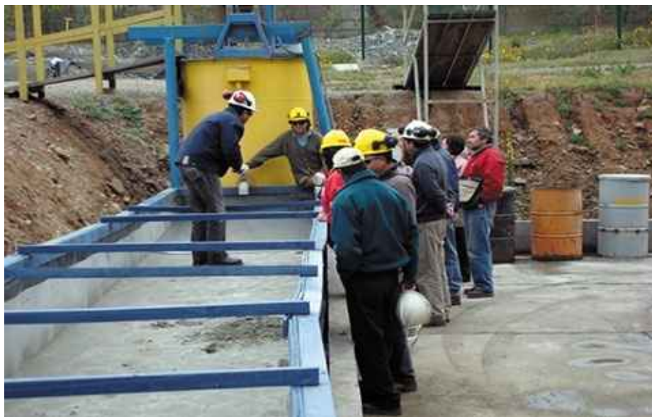
Comunidad observa demostración en Planta Piloto.

El proyecto DEP se encuentra en la etapa de construcción, periodo que culminará en diciembre de este año, con